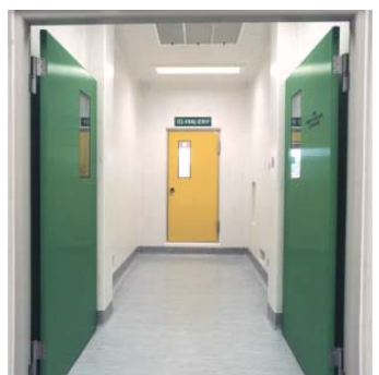
أبواب مفردة العمل من النوع K