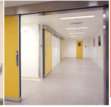
مسدود محكمة الإغلاق