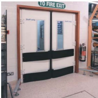
أبواب مروحية مزدوجة العمل من النوع S