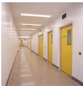
أبواب مقاومة للحريق لمدة ساعة من النوع F60