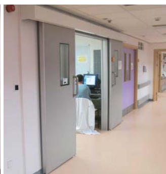
أبواب منزلقة ألياً ثنائية الأجزاء من النوع K