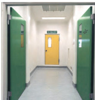
K Type Portes à action simple