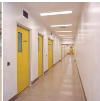
F60 Type Porte résistant au feu pendant 1 heure