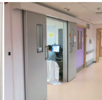
K Type Double porte coulissante automatique