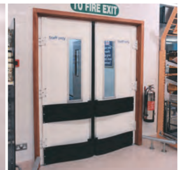
S Type Porte à battants double action